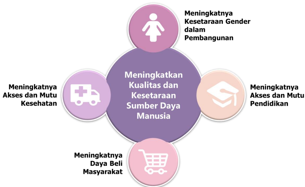
Gambar 4. 2. Sasaran Pada Tujuan Peningkatkan Kualitas dan Kesetaraan Sumber Daya Manusia