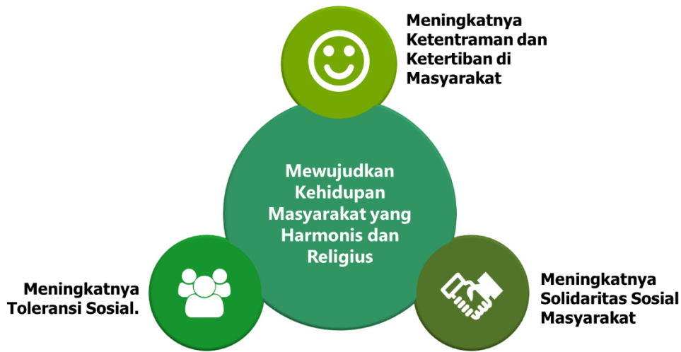
Gambar 4. 1. Sasaran Pada Tujuan Mewujudkan Kehidupan Masyarakat yang Harmonis dan Religius

Sebagai upaya untuk mencapai Misi II yakni “Membangun Masyarakat Situbondo Sehat, Cerdas Dan Meningkatkan Peran Perempuan”, maka tujuan pembangunannya adalah “Peningkatkan Kualitas dan Kesetaraan Sumber Daya Manusia”, yang dibentuk dari sasaran pembangunan: