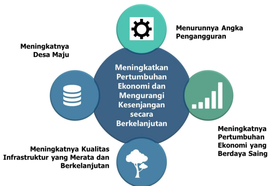
Gambar 4. 3. Sasaran Pada Tujuan Meningkatkan Pertumbuhan Ekonomi dan Mengurangi Kesenjangan secara Berkelanjutan

Sebagai upaya untuk mencapai Misi IV yakni “Membangun Pemerintahan yang Profesional, Bersih dan Tangguh”, maka tujuan pembangunannya adalah “Mewujudkan Kualitas Layanan dan Kapasitas Birokrasi yang Profesional”, yang dibentuk dari sasaran pembangunan: