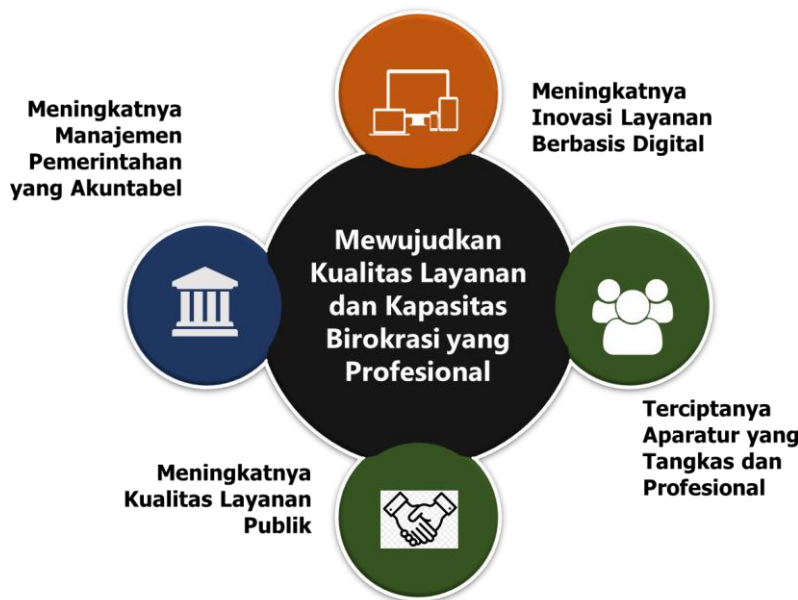
Gambar 4. 4. Sasaran Pada Tujuan Mewujudkan Kualitas Layanan dan Kapasitas Birokrasi yang Profesional

Berdasarkan penjelasan diatas tentang Visi, Misi, Tujuan dan Sasaran dalam RPJMD, maka dengan melihat proses konsistensi penjabaran Visi dan Misi ke dalam Tujuan dan Sasaran menentukan efektivitas pembangunan daerah sesuai dengan amanat pembangunan yang tertuang dalam Visi dan Misi Bupati. Berangkat dari tuntutan tersebut, maka dapat dijabarkan konsistensi Visi, Misi, Tujuan dan Sasaran tersebut ke dalam matriks berikut ini: